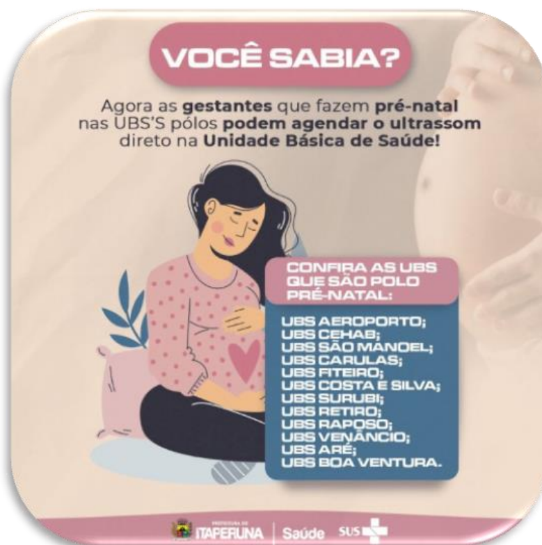
Figura 03 – Divulgação da Descentralização do Pré-natal nas UBS